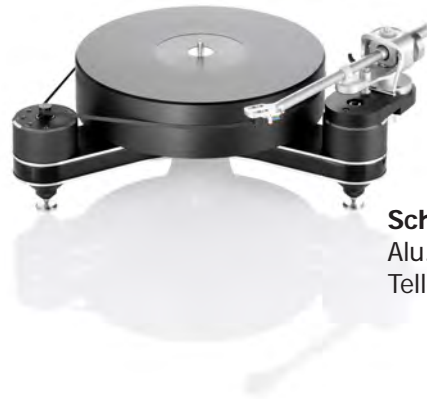
Schwarzer Klavierlack Alu.-Elemente: Schwarz Teller: Schwarz