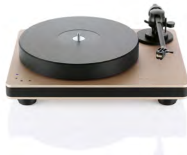
Rose gold with black chassis