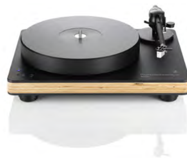
Black with wood chassis