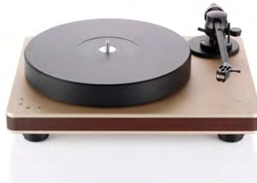
Rose gold with dark red wood chassis

Der Performance DC ist ein Laufwerk mit neu entwickeltem DC-Motor sowie Präzisionsgleitlager und Riemenantrieb. Der Plattenteller ist aus 40 mm starkem POM, der auf einem clearaudio CMB-Keramikmangetlager ruht. (Laufwerk ohne Tonarm und Tonabnehmer).