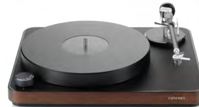
Dark wood chassis