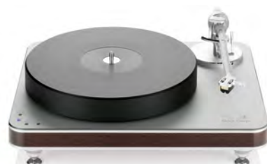
Silver with natural wood chassis