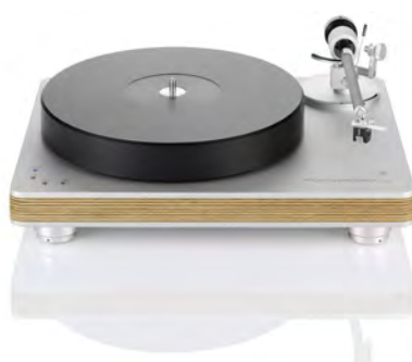
Silver with wood chassis