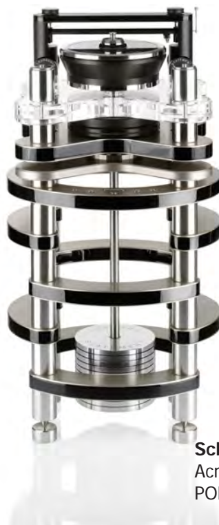
Schwarzer Klavierlack Acryl, Edelstahl, POM Teller