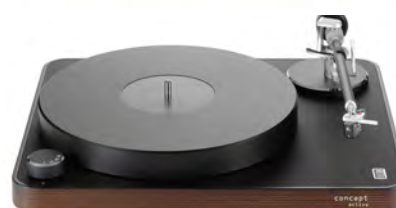
Dark wood chassis