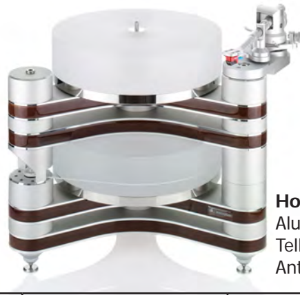
Holz natur Alu.-Elemente: Silber Teller: Acryl Antriebseinheit: Acryl