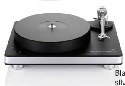
Black with silver chassis