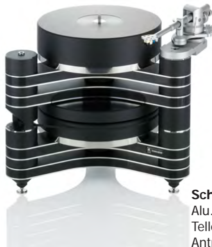
Schwarzer Klavierlack Alu.-Elemente: Schwarz Teller: Schwarz Antriebseinheit: Schwarz