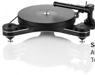
Schwarzer Klavierlack Alu.-Elemente: Schwarz Teller: Schwarz