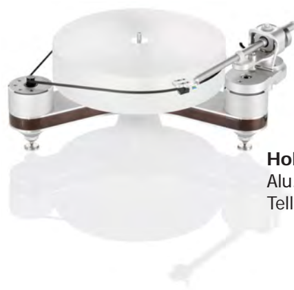
Holz natur Alu.-Elemente: Silber Teller: Acryl

TT029-IV: Alu.-Elemente: Schwarz, Teller: Acryl