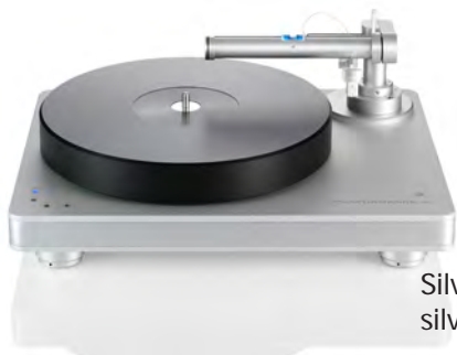
Silver with silver chassis