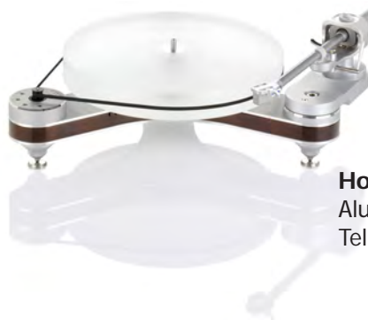
Holz natur Alu.-Elemente: Silber Teller: Acryl

TT042-IV: Alu.-Elemente Schwarz, Teller: Acryl