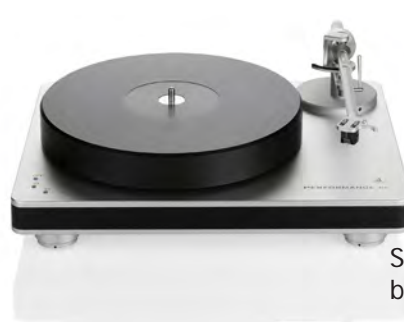
Silver with black chassis