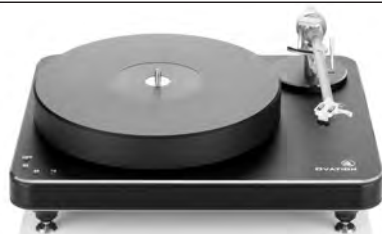
Black with black chassis