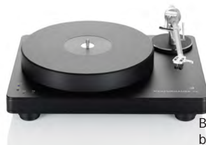
Black with black chassis